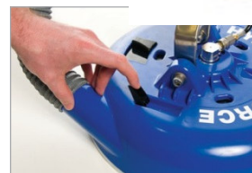
Bota EZ-LOC™ (cambio sin herramientas)