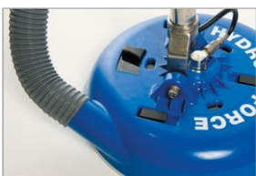
Línea Radial del aspirador