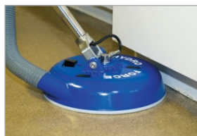
Perfil bajo (cabe en el zócalo)