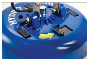
Válvula de Control Fácil